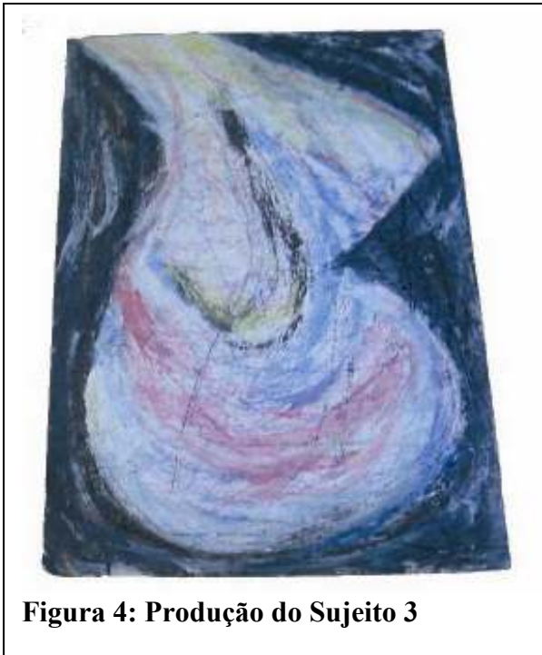
Figura 4: Produção do Sujeito 3

algumas vezes de trabalhos no Santo Daime.