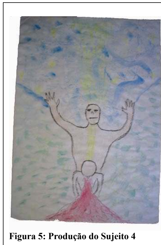
Figura 5: Produção do Sujeito 4

Neste capítulo pretendemos fazer uma análise qualitativa dos relatos dos sujeitos sobre os trabalhos produzidos com o material gráfico (todos escolheram trabalhar com o papel, tintas e lápis de cor), e o que ele tentou expressar de sua relação com a ayahuasca. Entendemos análise como uma tentativa de ver o que foi falado, e como isso foi falado,