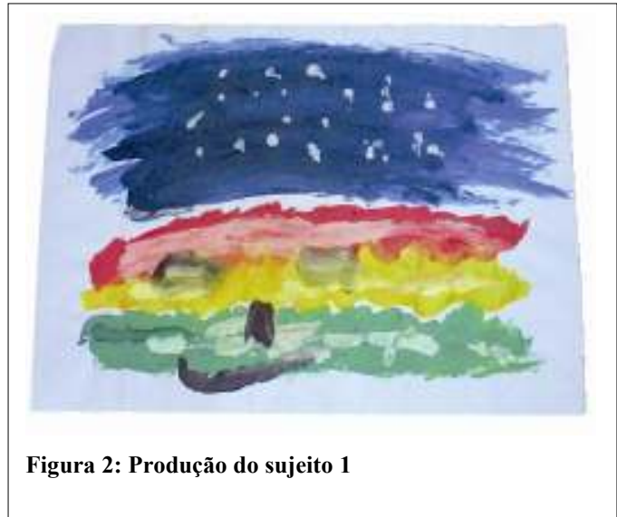
Figura 2: Produção do sujeito 1

- Sujeito 1: Estudante de administração de empresa com 20 anos que frequenta o templo há alguns meses. Identificou-se bastante com os trabalhos do Santo Daime, mas considera a Ayahuasca mais interessante pela liberdade que esta o proporciona.