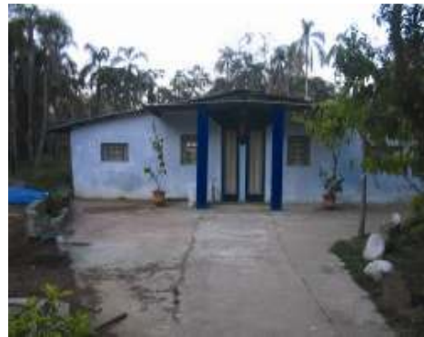
Figura 1: Frente do Templo